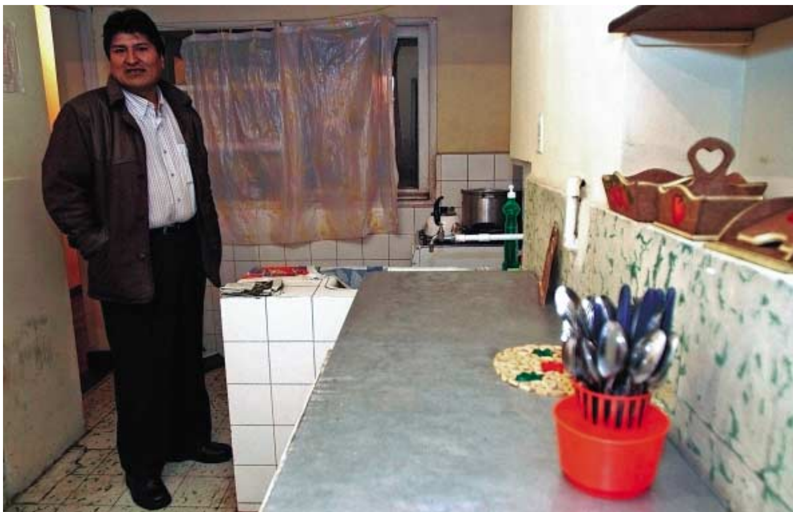
Evo Morales en la destartada cocina del piso que alquiló con sus compañeros de sindicato y que prefiere al suntuoso palacio presidencial.